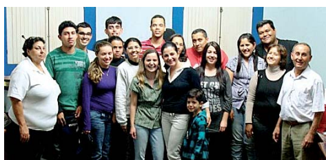
As duas turmas do curso realizado em Paraibuna exibem seus certificados

Essa é uma bandeira de luta antiga do Sindicato, que já há alguns