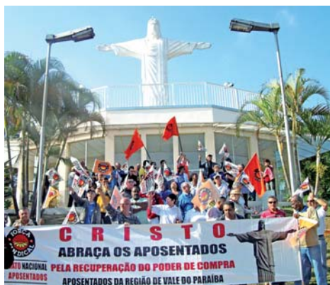
Manifestantes deram um abraço simbólico no Cristo Redentor

O ato foi convocado pelo Sindicato Nacional dos Aposentados, da Força Sindical (Sindinapi) e reuniu lideranças sindicais de diversos setores do País, com o objeti-