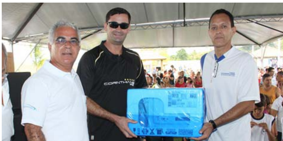
Presidente Albino entrega o prêmio ao comerciário ??? que levou um microondas

Crianças - Foi preparada toda uma infraestrutura especial para as crianças com pula-pula, escorregador inflável, touro mecânico, pinturas de rosto, além de sorvete grátis.