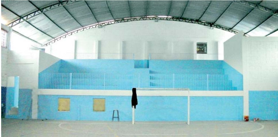
Mais conforto: o ginásio poliesportivo ganhou arquibancada, vestiários, duchas e pias