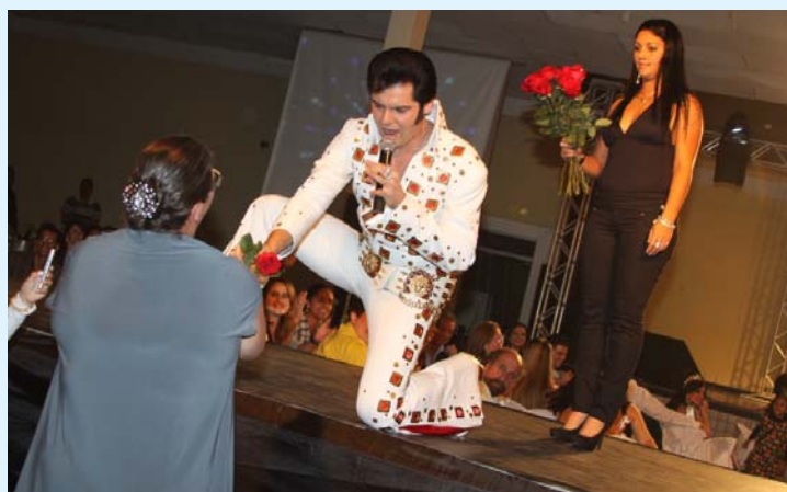
Elvis Presley Cover cantou e animou a plateia