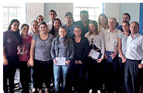
Foto maior, uma das turmas do cursos de Paraibuna. Foto menor, turma de Caçapava exibindo seu certificados

"Ficava difícil para os comerciantes se deslocarem de Paraibuna