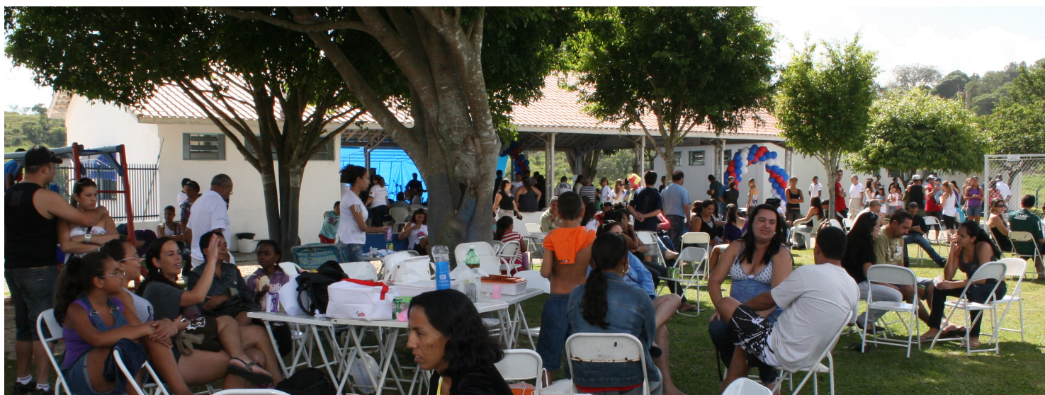
A família comerciária compareceu em peso à festa promovida pelo Sindicato para comemorar o 1º de Maio