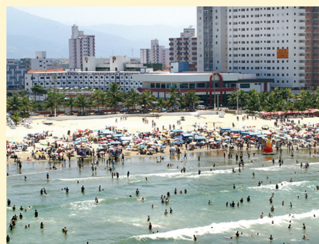
Colônia de Férias em Praia Grande