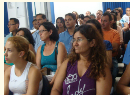
Alunos acompanham atentamente

MAIS INFORMAÇÕES - Na sede do Sindicato, à avenida Dr. Mario Galvão, 56, Jardim Bela Vista, São José dos Campos. Telefone 3921.2455 ou em nosso site: www.sec-sjc.com.br .