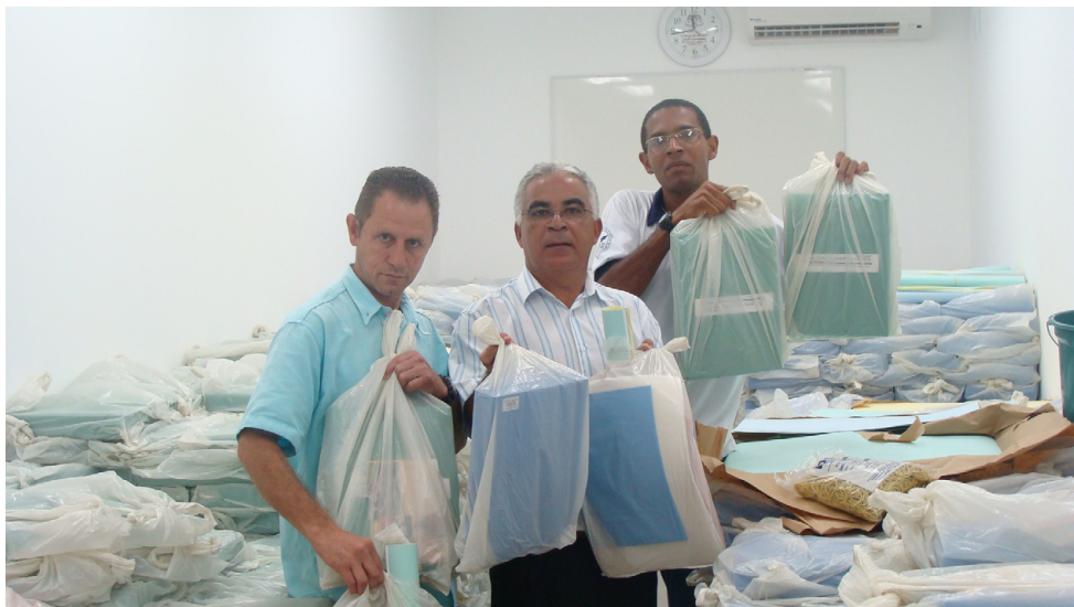
Presidente Albino e diretores fizeram a entrega dos materiais