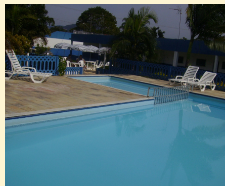
Piscina da Colônia de Caraguá

Informações e reservas, ligue 3921.2455.